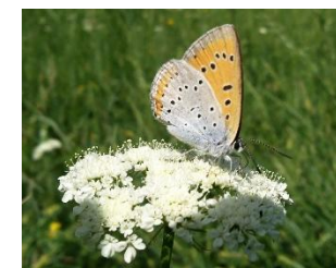
Le Cuivré des marais

D'autres sites Natura 2000 sont présents à proximité. Ils forment ensemble un réseau capital dans le cycle de vie des chauves-souris. Cependant, ces sites ont leurs propres spécificités : celui de la vallée de la Saye accueille la Loutre d'Europe ou le Cuivré des marais, alors que celui de la Dordogne est ciblé pour la conservation des poissons migrateurs amphihalins.