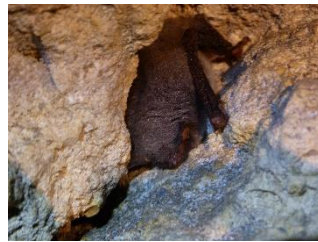
Murin de Daubenton