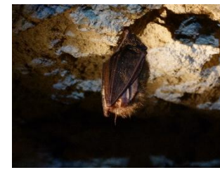
Oreillard en hibernation