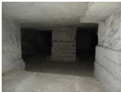
Intérieur de carrière souterraine

Le site Natura 2000 des « Carrières souterraines de Villegouge » s'étend sur 960,2 ha sur les communes de Villegouge, Saint-Germain-de-la-Rivière, Lugon-et-l'Île-du-Carney, La Rivière et Saint-Aignan. Cette zone est centralisée sur le lieu-dit de Meyney et s'étend jusqu'à la Dordogne.