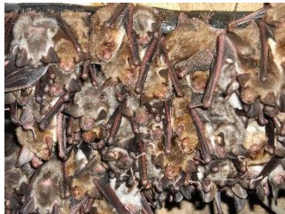
Essaim de Grands murins