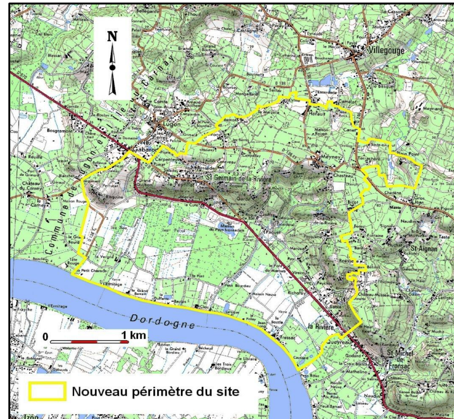
Périmètre du site Natura 2000 des carrières souterraines de Villegouge

Le palus, directement en contact avec la Dordogne, reçoit une partie des eaux de ruissellement du site et forme une entité qui était autrefois dominée par le pastoralisme et quelques parcelles de vignes. De nos jours, la déprise agricole a conduit à un boisement naturel ou volontaire de cet espace. Sur le plateau s'étend le terroir viticole du Fronsadais. La liaison entre les deux entités est formée par un coteau dominé par les boisements de feuillus et les principaux châteaux du secteur.